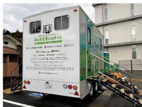
トイレトレーラー

フレッセイでは1986年から店舗に募金箱を設置し、お客様からお預かりした寄付金を浄銭として地域社会への福祉につなげています。2022年度はトイレを設置したトレーラーを派遣するトイレネットワークプロジェクトへ117万円を寄付し、令和6年能登半島地震でトイレが活用されました。また、群馬県高崎市が行う「おとしよりぐるりんタクシー」、渋川市が行う「あいのりタクシー」の取り組みに賛同し、タクシーの乗降場所を提供しています。