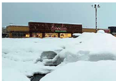
2022年豪雪 原信 花園店