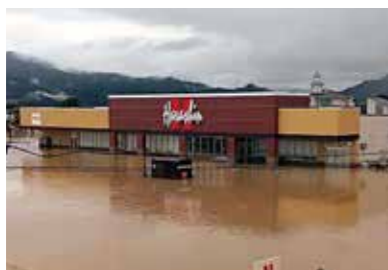
2022年豪雨 原信 荒川店

これらの運営は、災害で店舗が閉店に追い込まれてもライフラインとしての使命を果たすために「一分でも早くお店を開ける」という考え方に基づくものです。これからもこの使命を胸に店舗運営を続けてまいります。