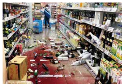
2024年能登半島地震 ナルス 柿崎店