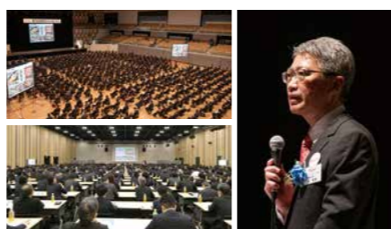
原信ナルス会・フレッセイ共栄会

取引先様から確実に商品供給を受けられるよう、強固な関係構築すべく、当社グループの政策を取引先様にご理解いただく場として「原信ナルス会」と「フレッセイ共栄会」2つの会を開催しております。今後、より強固なライフラインの基盤づくり、そしてさらなるマスメリットの創出に向けて、ステップアップした新たな会合の創設に向けて検討・準備を進めています。